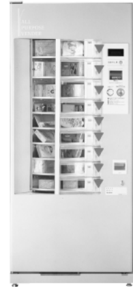
外形寸法: (W×D×H) 800×685×1830mm・重量150kg