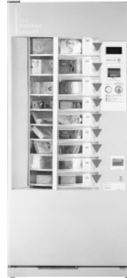
外形寸法 (W×D×H) 800×685×1830mm・重量150kg

企画・発売元 SEBE セベ産科用品株式会社 〒812-0016 福岡市博多区博多駅前4丁目11-11 TEL (092) 472-4316